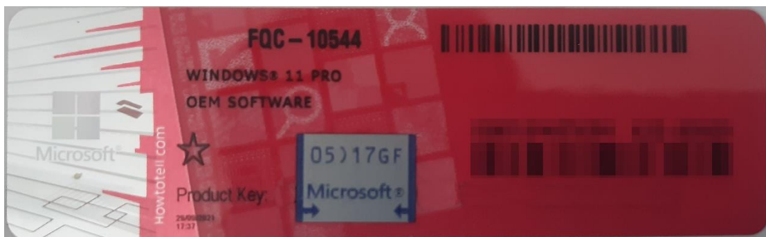
Rys. 1 przykładowy kod zabezpieczony przez producenta systemu Microsoft Windows 11 (takie same naklejki mają Windows 10) z wymazanym, znajdującym się przed i za szarą naklejką kodem licencyjnym

Poniższe zdjęcie obrazuje obecnie stosowane zabezpieczenia producenta firmy Microsoft (klucz systemu jest zabezpieczony naklejką hologramową przez producenta. Po jej zdrapaniu uzyskujemy dostęp do oryginalnego klucza):